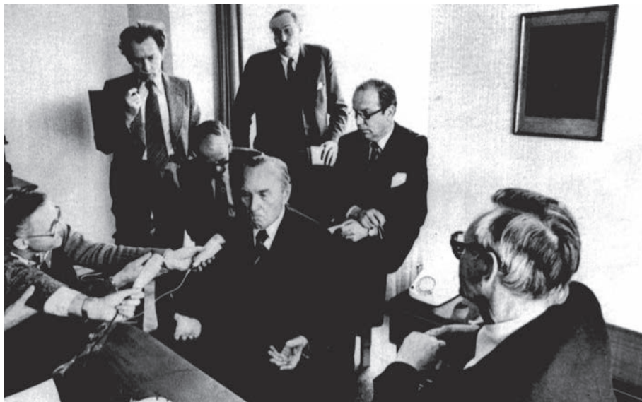
Jan Patočka prezentuje Chartu 77 ministru Van der Stoelovi. Lze si vyposlechnout nad digitálně ozvučeným fotem na http://bit.ly/VanDerStoele